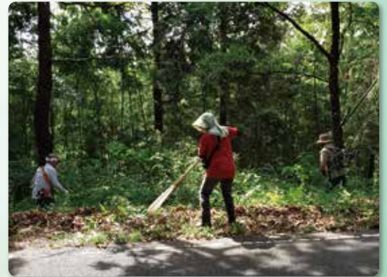
県民参加の森づくり(菊鹿町)