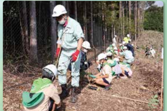
緑の少年団による植樹作業(山江村)