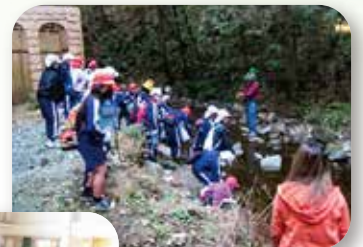
森林環境学習(山鹿市)