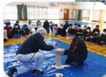
森林木工教室(菊陽町)