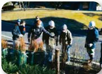
県民参加の森林づくり(西原村)