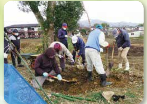
花木友の森(宇土市)