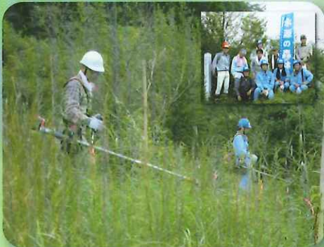
森林ボランティアによる下刈り作業(西原村)