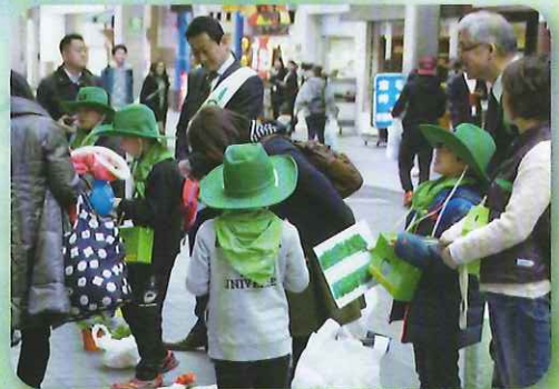
緑の少年団による募金活動(熊本市)