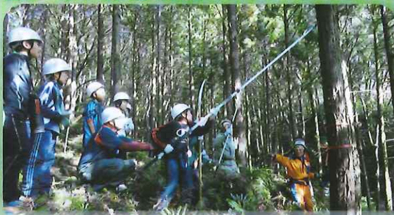
緑の少年団による育樹(枝打ち)活動(天草市)