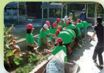
花苗の配布活動 (玉名地域)