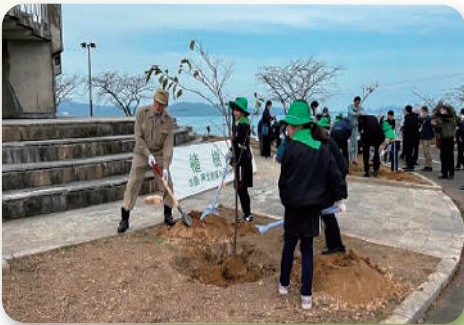
地域植樹祭 (芦北地域)