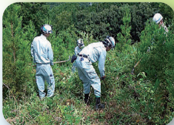
県民参加の森林づくり (球磨郡山江村)