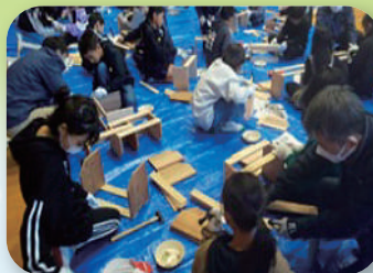
木工教室 (菊池地域)