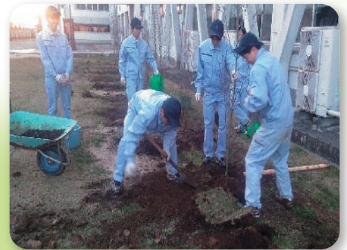
花木友の森 (熊本市)