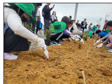
【花の苗の配布や植栽活動】