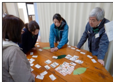
第1回森林ボランティア初心者研修会（令和6年12月14日：監物台樹木園）