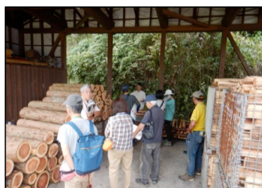
森林ボランティアリーダー研修会（令和6年9月28日：小国町・南小国町）