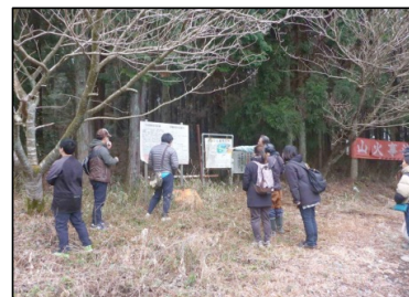
第2回森林ボランティア初心者研修会（令和7年2月15日：西原村）