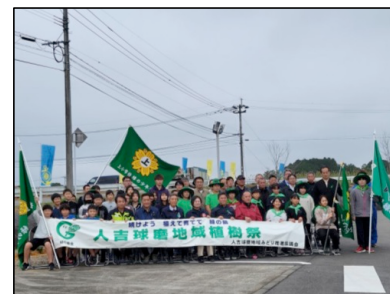
【地域の植樹祭など】