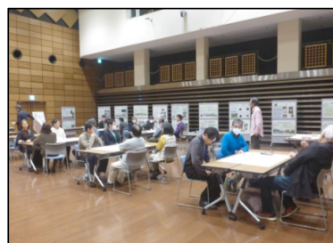
森づくり活動の日（令和6年11月10日）と活動報告・交流会（令和7年1月26日）