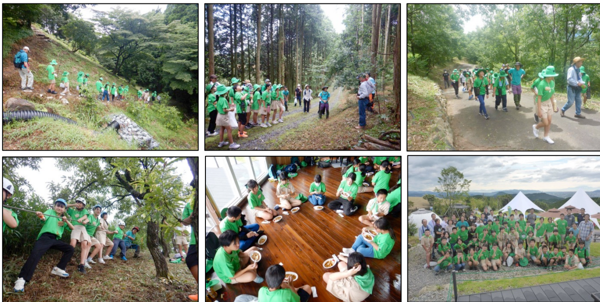
全県緑の少年団交流集会（令和6年7月26日：御船町）

熊本県緑化推進委員会では、緑の少年団活動や学校緑化、森林・林業学習や体験、自然観察などの活動を支援しています。