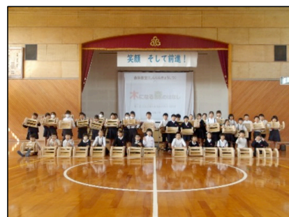
【野外活動や木工教室など】