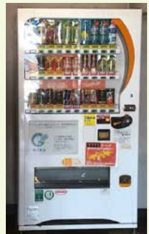
大津町生涯学習センター