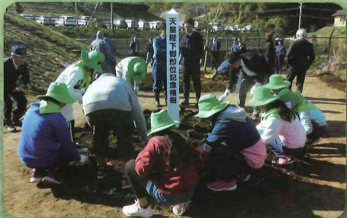
緑の少年団による植樹作業(美里町)