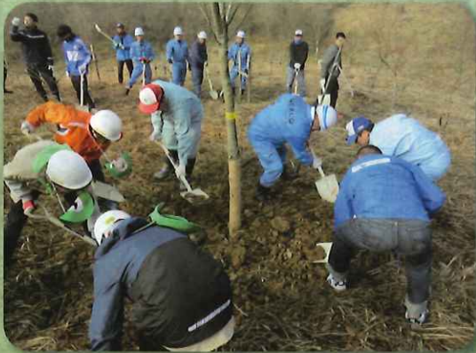
森林ボランティアによる植栽作業(山江村)