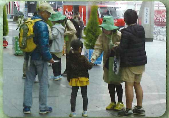
緑の少年団による募金活動(熊本市)